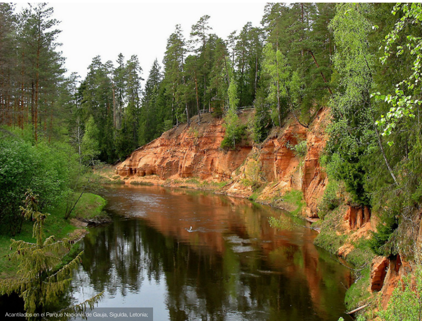
Acantilados en el Parque Nacional de Gauja, Sigulda, Letonia;