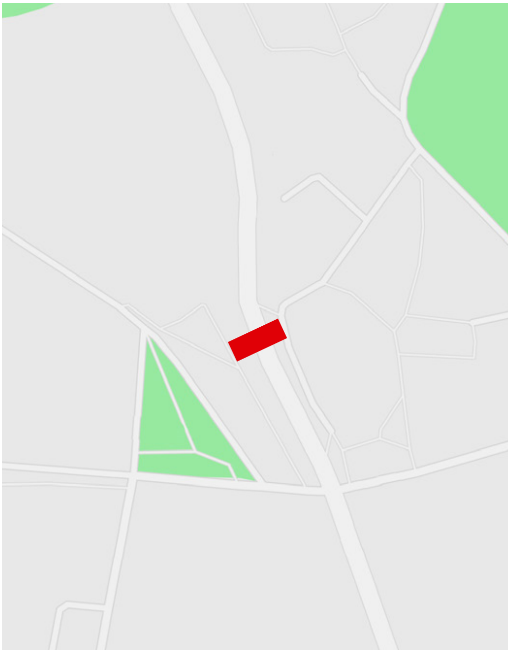
Ubicación sugerida del puente peatonal