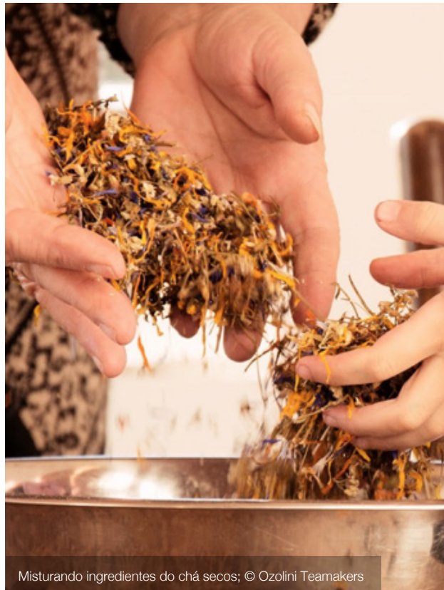
Misturando ingredientes do chá secos