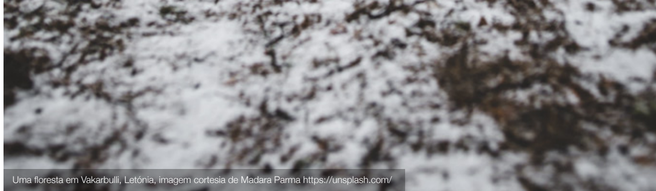
Uma floresta em Vakarbulli, Letónia, imagem cortesia de Madara Parma https://unsplash.com/

No entanto, esses recursos são finitos, e assim foram tomadas medidas significativas para preservá-los, não só para o seu próprio bem, mas igualmente para os benefícios económicos que proporcionam em termos de turismo.