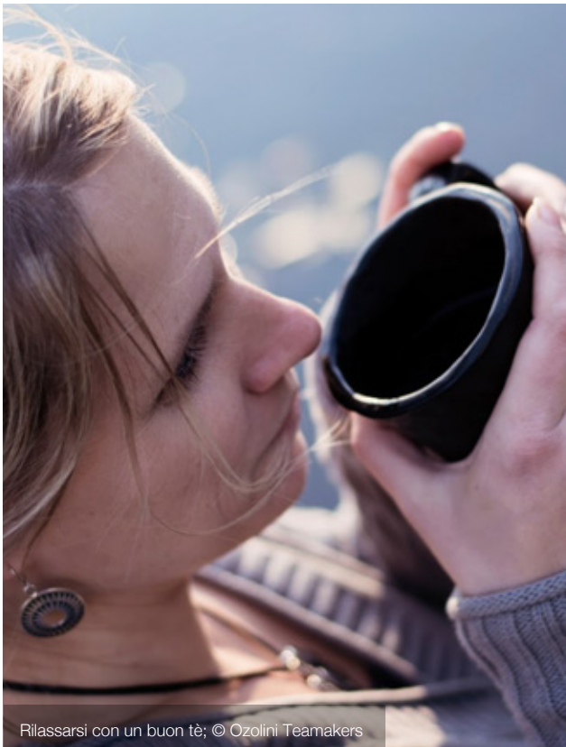
Rilassarsi con un buon tè