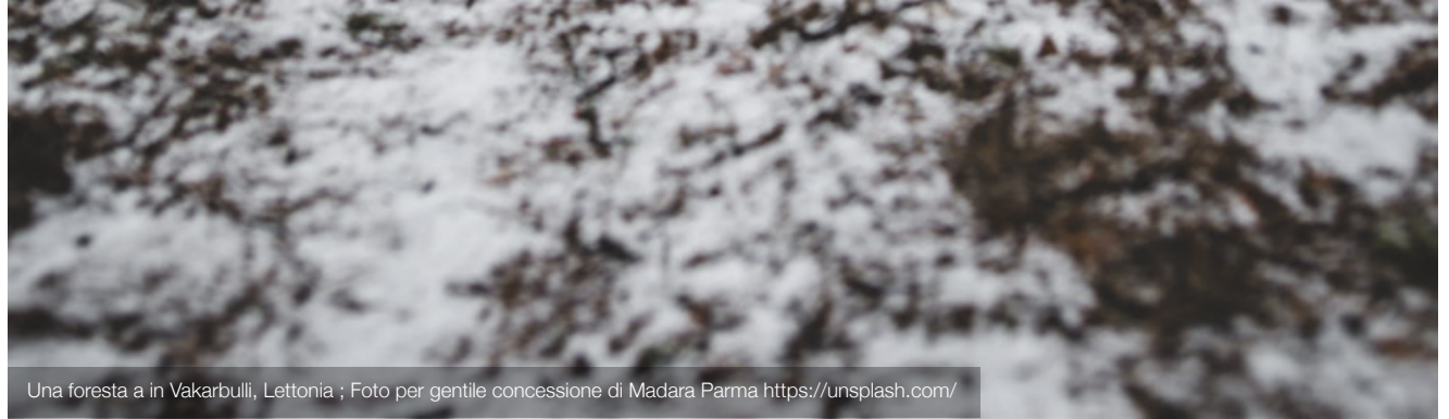
Una foresta a in Vakarbuli, Lettonia ; Foto per gentile concessione di Madara Parma https://unsplash.com/

Approssimativamente il 20% della Lettonia è area protetta, con quattro parchi nazionali, 42 parchi naturali, 260 riserve naturali, 355 monumenti naturali, sette aree marine protette ed una riserva della biosfera. Queste risorse sono comunque limitate e sono state prese numerose misure per preservarle, non solo per il loro valore in sé, ma per i vantaggi economici che apportano in termini di turismo.