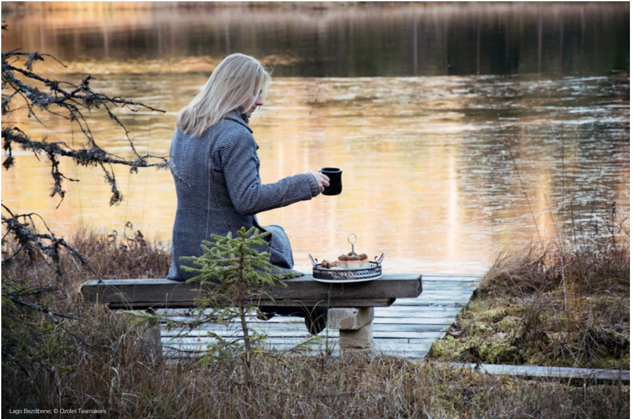
Lago Bezdibene